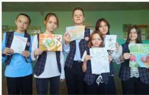
АКЦИЯ «ПИСЬМО СОЛДАТУ»