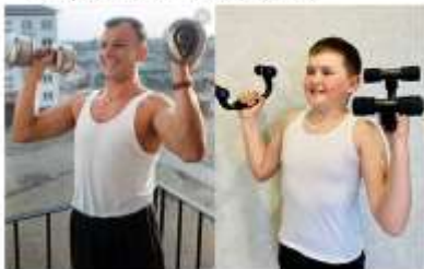
АКЦИЯ «УЛЫБКА ГАГАРИНА»