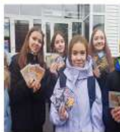
«Математический квест» (1-6 классы)